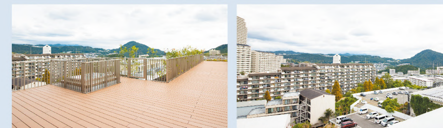
屋上 見晴らしのいい屋上で、ガーデニングもできます。